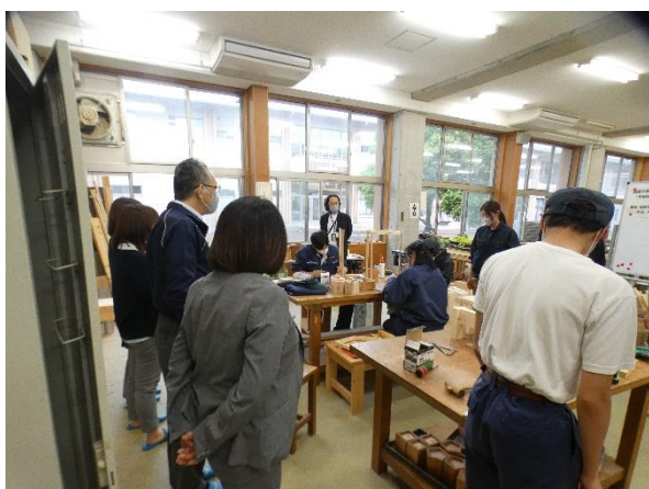
授業「工業」見学の様子】