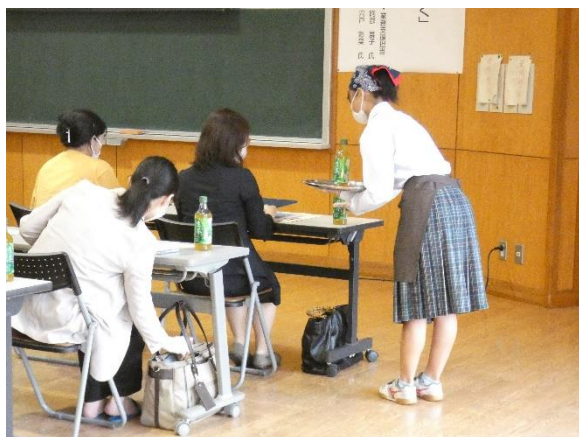
【見学会前の接客の様子】