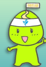
岩学マスコットキャラクター いわっち