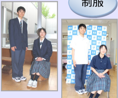
夏はポロシャツでさわやかに